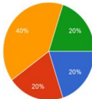
Figura 2. Reducción de hobbies y actividades de ocio.

En la Figura 1, El 50% de los participantes reportó que la carga académica es la principal causa de su agotamiento. Este resultado fue más frecuente entre los estudiantes, quienes mencionaron las siguientes razones como las más relevantes: la cantidad de tareas y exámenes, la falta de tiempo para actividades extracurriculares y la presión por obtener buenas calificaciones. Estos factores generaron un nivel significativo de estrés entre los estudiantes, lo que llevó a muchos a experimentar agotamiento emocional debido a la intensa dedicación a sus estudios.