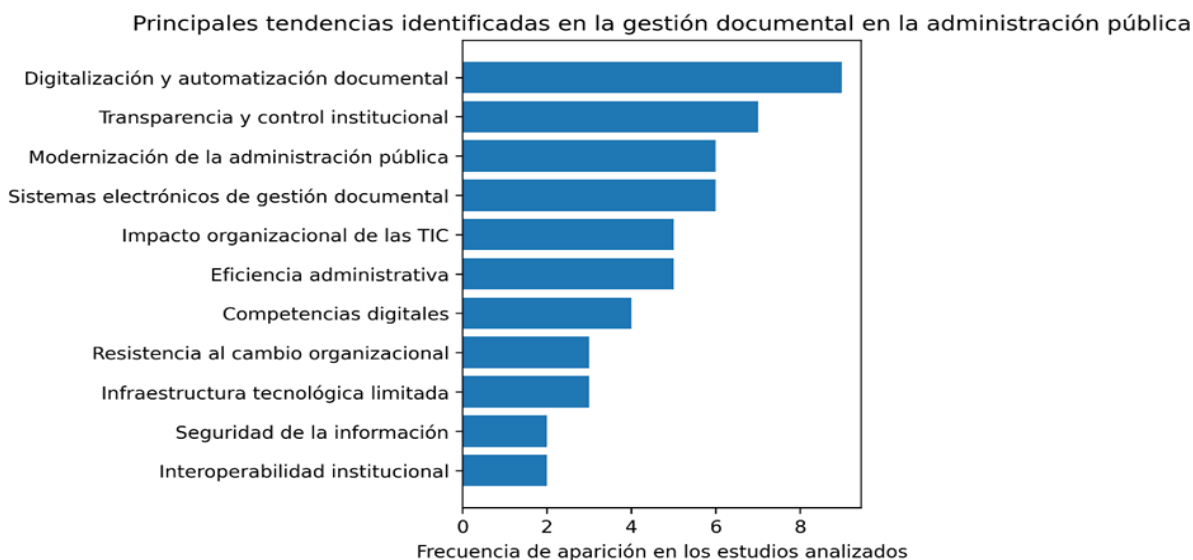
Figura 2. Gráfico de tendencias identificadas en la gestión documental en la administración pública.

Desde una visión global, los estudios revisados coinciden en señalar que la gestión documental ocupa un lugar estratégico en los procesos de modernización de la administración pública. La eficiencia administrativa ha mejorado, la transparencia de las instituciones se ha fortalecido y el acceso de los ciudadanos a la información pública se ha facilitado gracias a la digitalización de los documentos, el establecimiento de sistemas electrónicos para gestionar documentos y la incorporación de tecnologías emergentes. Por el contrario, la literatura también indica que la adopción efectiva de estas tecnologías depende de varios factores organizacionales, como la capacitación personal administrativo, la disponibilidad de infraestructura tecnológica y la capacidad de las instituciones para gestionar procesos de transformación en su estructura. Así pues, la gestión documental debe ser entendida no únicamente como un procedimiento técnico para administrar documentos, sino también como un elemento estratégico para la modernización del sector público y el cambio organizacional.